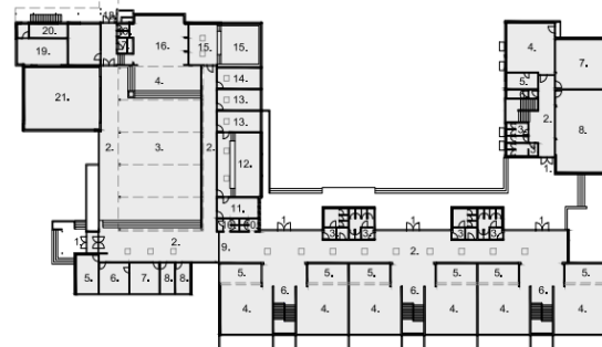
основа на приземје